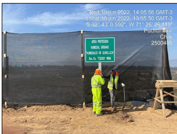
Figura 01: Implementación de Señalética en Sector 2 cercanos al punto 18 del Humedal Quirilluca dm 27.920

Seguimiento fotográfico de la implementación de señalética informativa en puntos de la obra cercanos al Humedal Urbano "Humedales de Quirilluca" Res. Ex. 772/2021 y "Los Maitenes – Campiche" Res. Ex.773/2021.