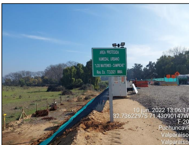
Figura 04: Implementación de Señalética en margen izquierdo estribo de entrada Puente Puchuncaví