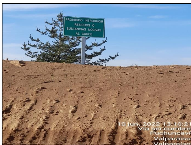
Figura 02: Implementación de Señalética en Sector 2 cercanos al punto 15 del Humedal Quirilluca dm 27420