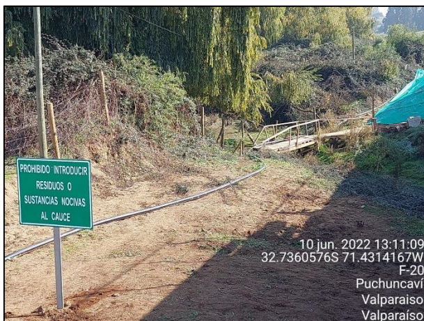
Figura 05: Implementación de Señalética en margen izquierdo estribo de entrada Puente Puchuncaví dm 25320