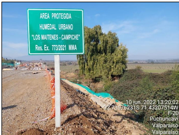
Figura 06: Implementación de Señalética en margen izquierdo estribo de salida Puente Puchuncavi dm 25360